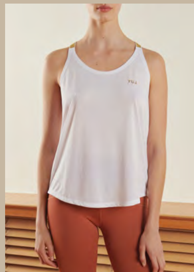
YUI : Top, 100% polyester, 49 €. Ensemble, 90% polyamide, 10% élasthanne : Brassière, 49 €. Legging, 79 €.