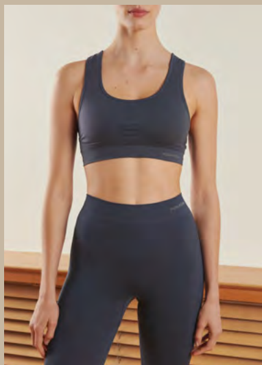
ORGANIC BASICS, 89% Nylon, 11% élasthanne : Brassière, 65 €. Legging, 81 €.