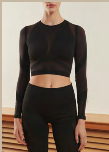
WOLFORD x ADIDAS, 94% polyamide, 6% élasthanne : Top, 120 €. Legging, 120 €.