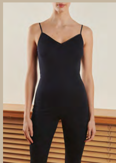
HANRO, Top : 100% coton, 41 €. Legging : 94% viscose, 6% élasthanne, 95 €.