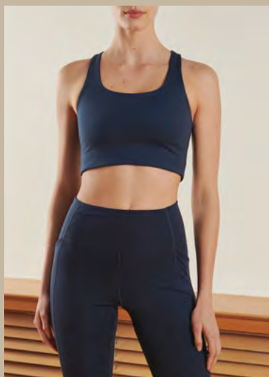
GIRLFRIEND COLLECTIVE, 79% polyester recyclé, 21% élasthanne : Brassière, 38 €. Legging, 68 €.