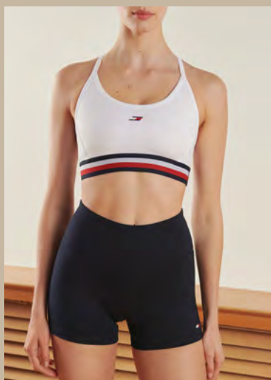
TOMMY HILFIGER, 76% polyester, 24% élasthanne : Brassière, 50 €. Short, 40 €.