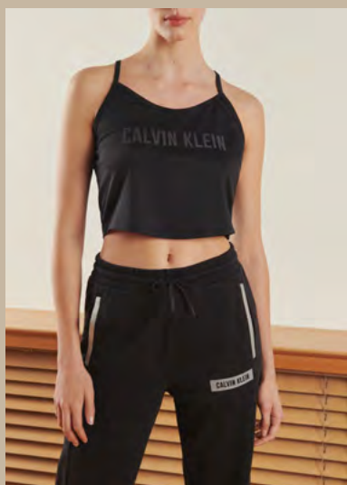
CALVIN KLEIN : Crop top, 88% polyester, 12% élasthanne, 35 €. Jogging, 100% coton, 70 €.