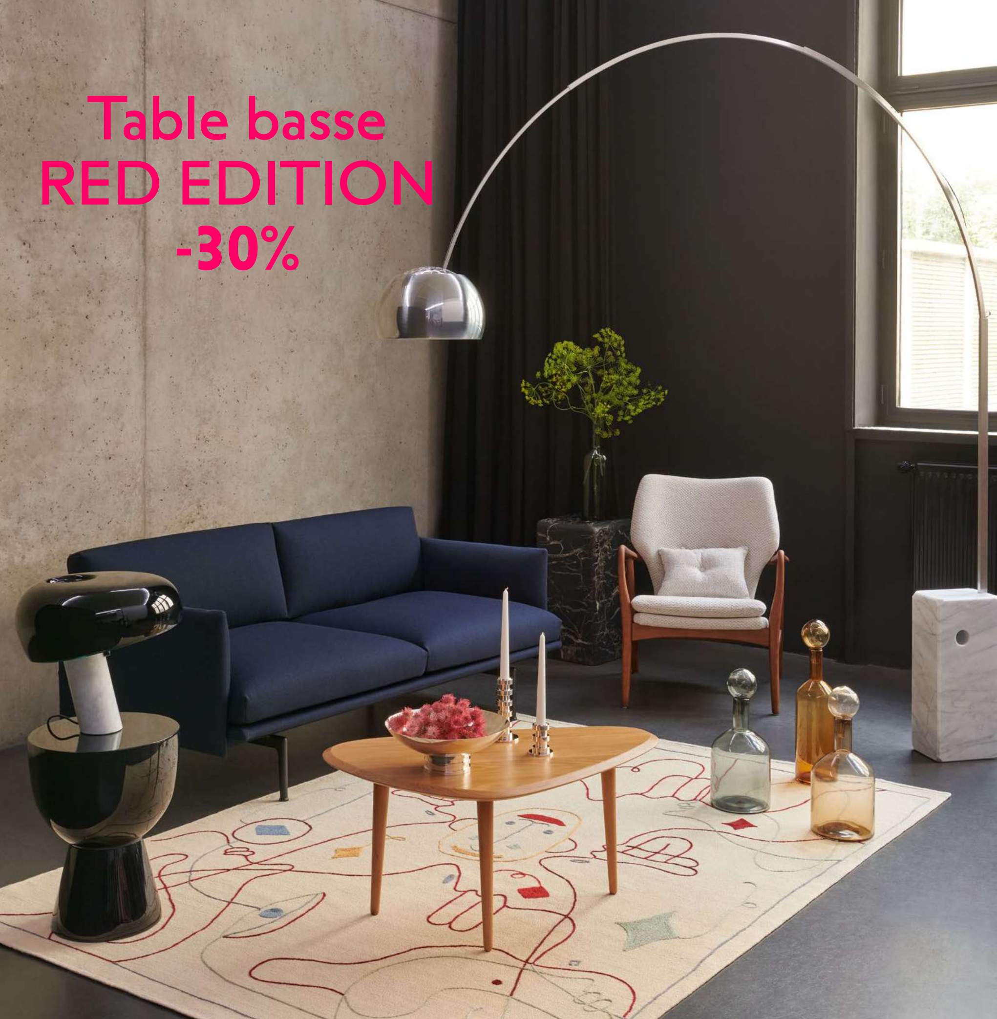
Table basse RED EDITION -30%