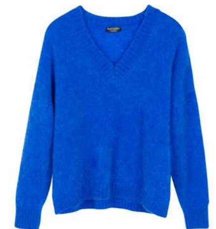
-30% Pull AU PRINTEMPS PARIS (1) , 82% mohair, 16% polyamide, 2% élasthanne, 105€ 73 € .