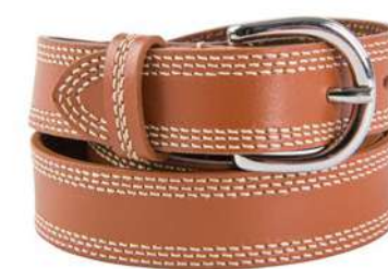
-30% Ceinture AU PRINTEMPS PARIS (1) , cuir de vachette, 45€ 29 € .