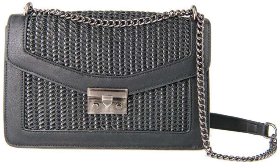
-40% Sac AU PRINTEMPS PARIS (1) , 100% polyuréthane, 79€ 47 € .