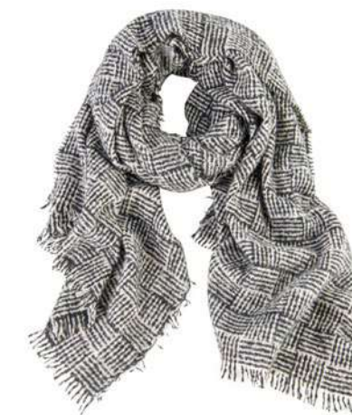
-30% Écharpe AU PRINTEMPS PARIS (1) , 100% acrylique, 39€ 27 € .