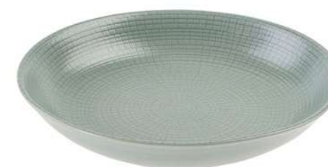
-30% Saladier DEGRENNE (1) , grès, 39€ 27,30 € .