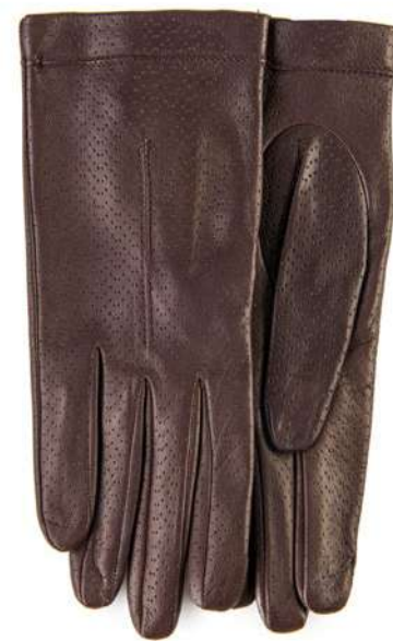
-30% Gants AU PRINTEMPS PARIS (1) , cuir d'agneau, 59€ 39 € .