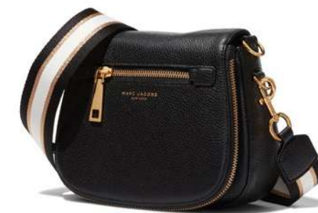
-30% Sac MARC JACOBS (3) , cuir de vache, 440 € 308 € .