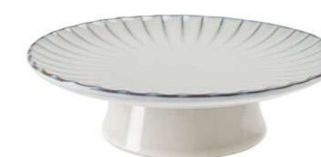
-30% Plat à gâteau SERAX (5) , grès, 52€ 36,40 € .