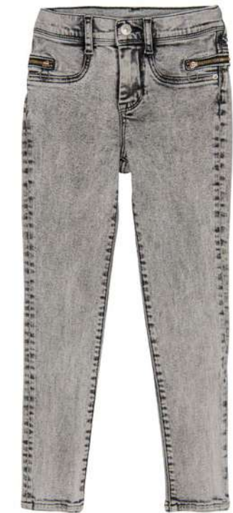
-30% Jean TEDDY SMITH (1) , 98% coton, 2% élasthanne, 60 € 42 € .