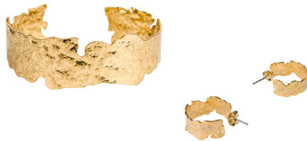
-30% Boucles d'oreilles AU PRINTEMPS PARIS (1) , 100% laiton, 29€ 19 € .