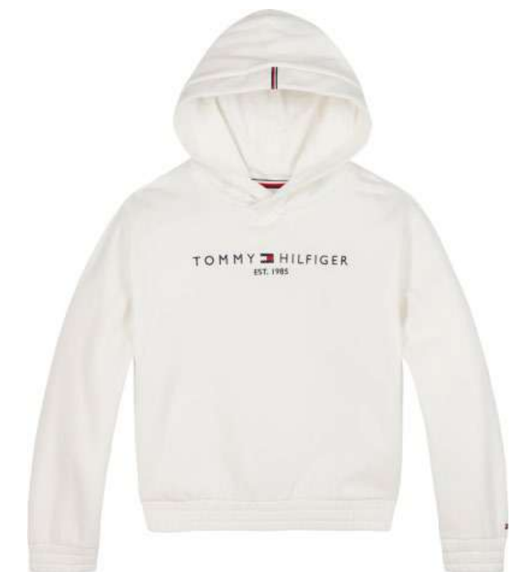
-30% Sweat-shirt TOMMY HILFIGER (3) , 72% coton organique, 22% polyester, 6% élasthanne, 70 € 49 € .