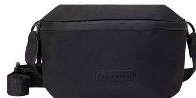
-30% Banane UCON ACROBATICS (2) , polyester, 45 € 31,50 € .