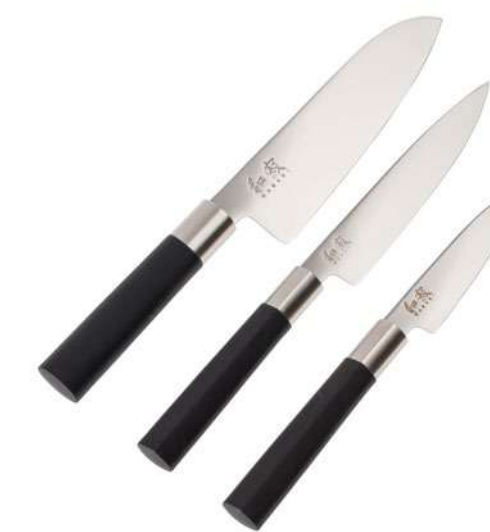
-30% Set de 3 couteaux KAI (2) , acier, poudre de bambou et polypropylène, 139€ 95 € .