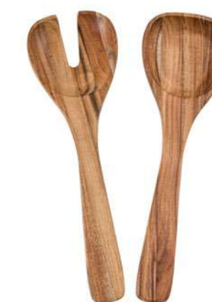
-30% Couverts à salade VILLEROY & BOCH (4) , acacia, 19,9€ 13,93 € .