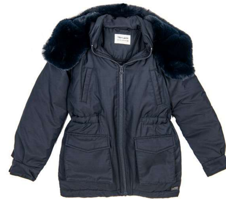
-30% Parka TEDDY SMITH (1) , 100% polyester, 100 € 70 € .