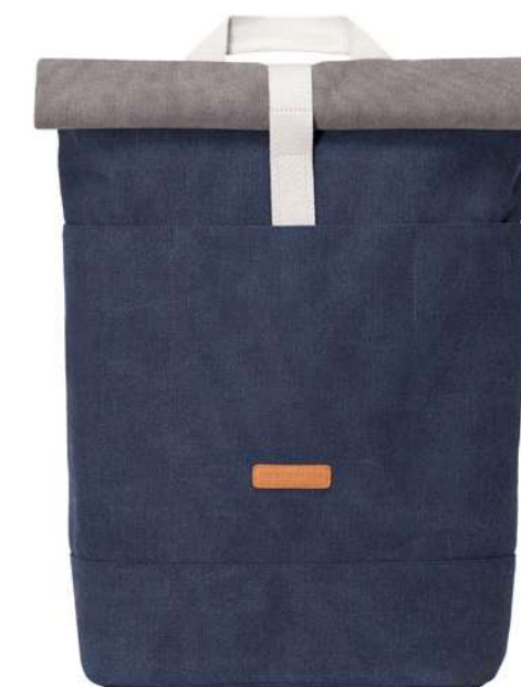
-30% Sac à dos UCON ACROBATICS (2) , 100% coton canvas, 85 € 59,50 € .