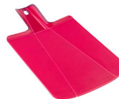
-30% Planche à découper JOSEPH JOSEPH (3) , polypropylène sans BPA et sans silicone, 19,99€ 13,99 € .