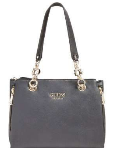
-30% Sac GUESS (5) , 100% polyuréthane, 149 € 104 € .