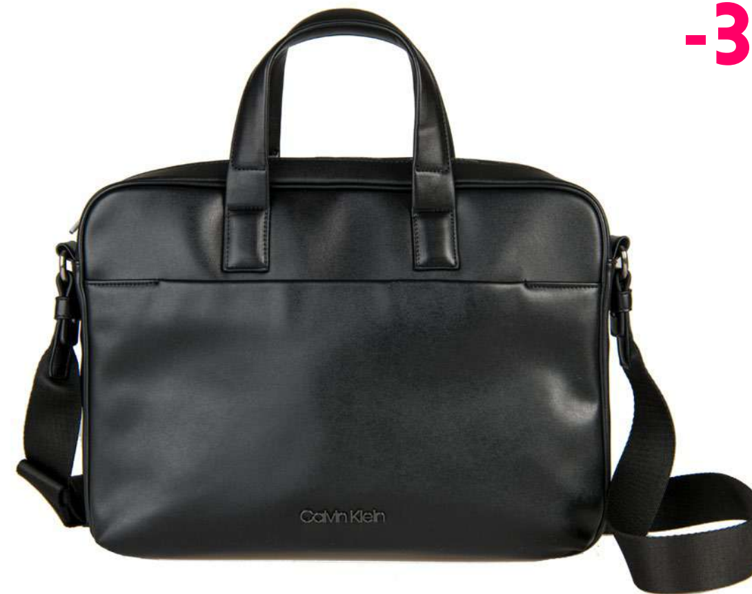
-30% Porte-documents CALVIN KLEIN (1) , 100% polyuréthane, 125 € 87 € .