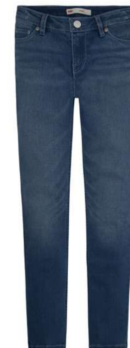
-30% Jean LEVI'S (2) , 57.3% coton, 34.8% polyester, 6.5% viscose, 1.4% élasthanne, à partir de 45 € 31 € .