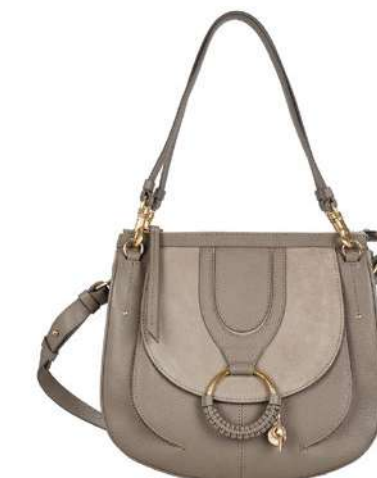
-30% Sac SEE BY CHLOE (4) , cuir de vache, 485 € 336 € .